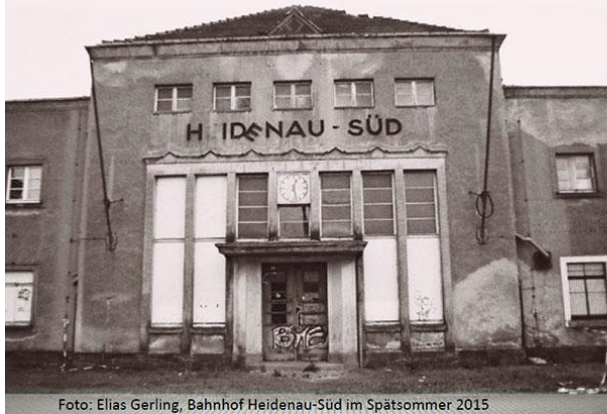
Bahnhof Heidenau-Süd im Spätsommer 2015

Deutsches Hygienemuseum, Lingnerplatz 1, 01069 Dresden